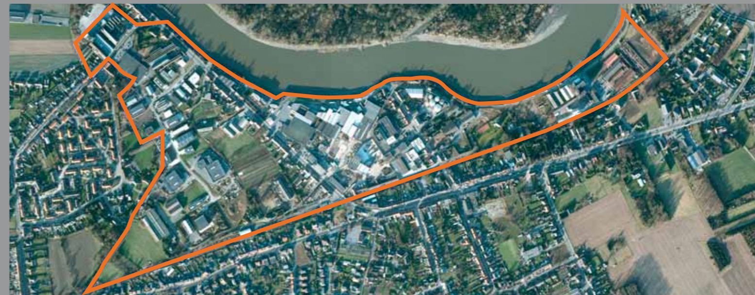
afbakening van het plangebied

Bij de opmaak van het inrichtingsplan wordt vooral een betere leefbaarheid van het gebied nagestreefd. Aan de rand van het industriegebied worden de nodige groenbuffers voorzien om de leefbaarheid van de omgeving te maximaliseren.